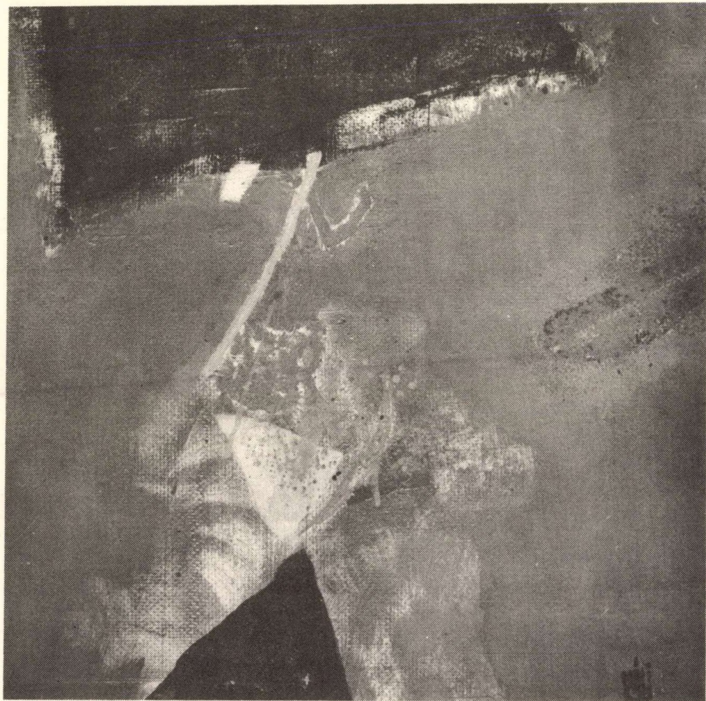
Emberek között 35 × 35 cm, 1982