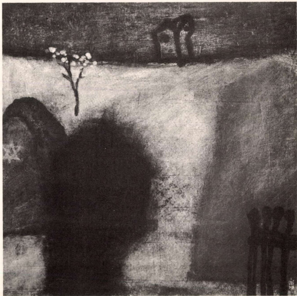
Régi zsidó temető- virágzó fával 60 × 60 cm, 1984