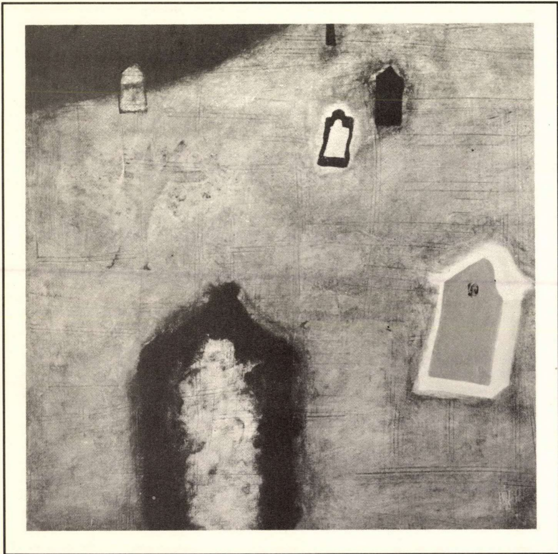
Régi zsidó temető- nyugalom 60×60 cm, 1985