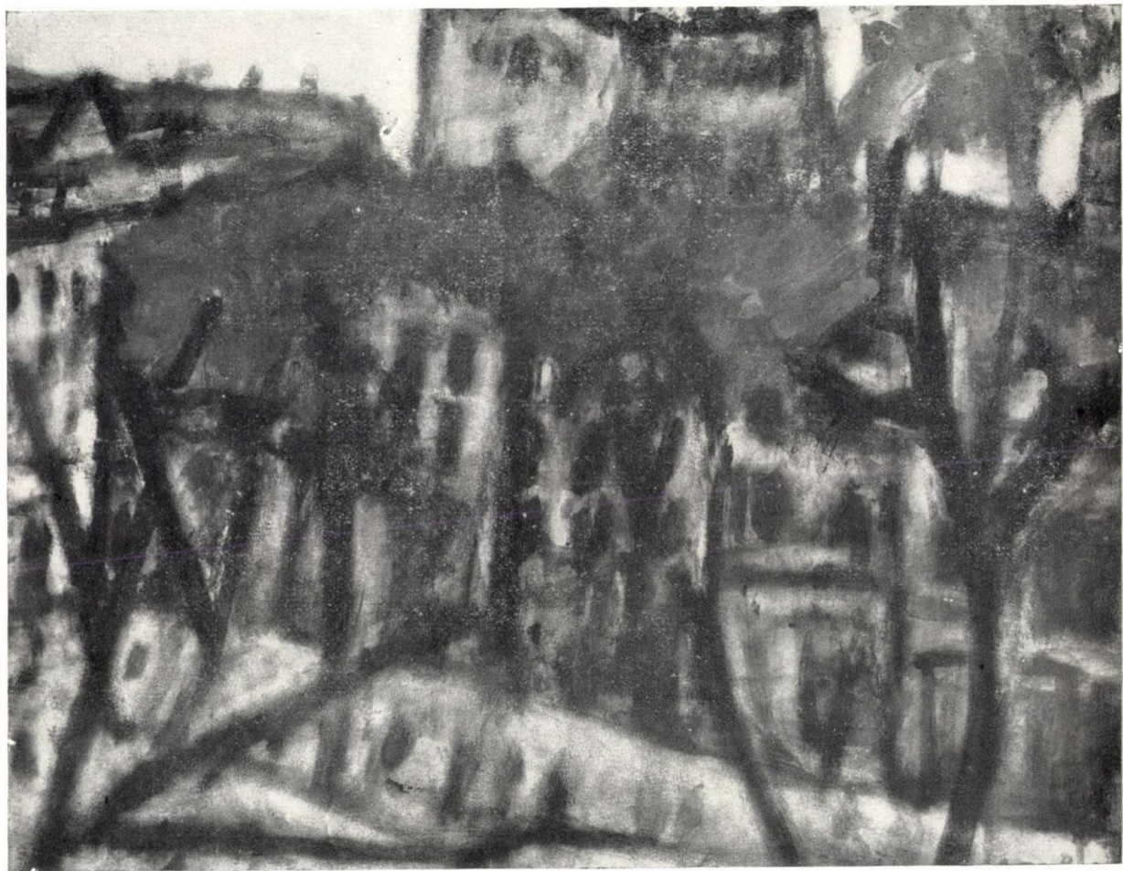
PÁRIZSI UTCA 1920-AS ÉVEK