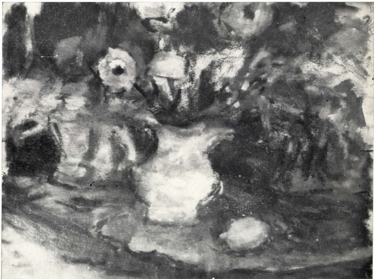
SÁRGA VIRÁGOK, 1954.