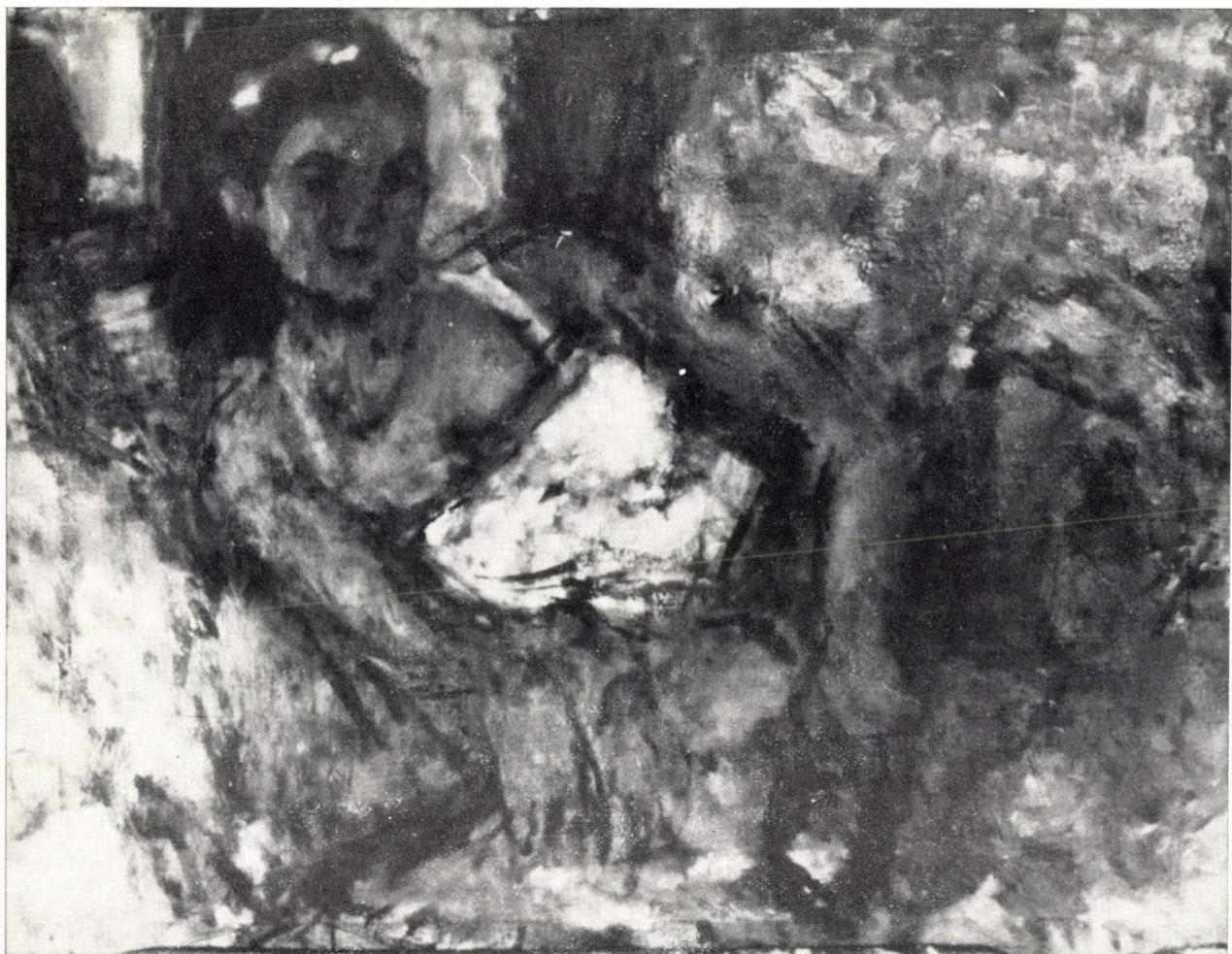
FEKVŐ NŐ, 1966.