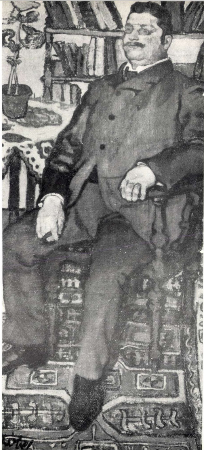
ÜLÖ FÉRFI, 1906.