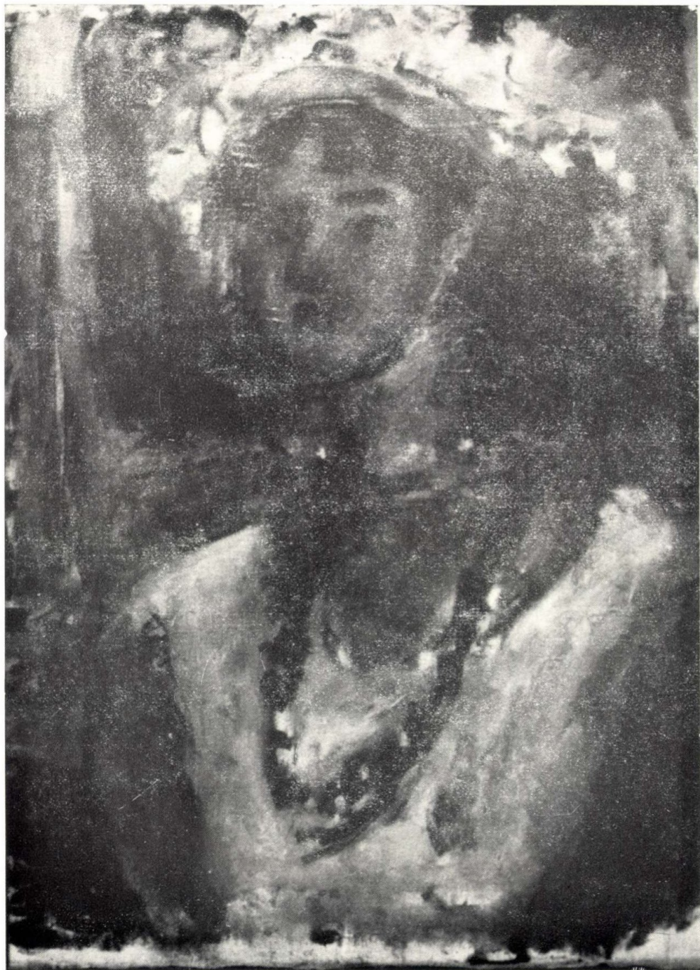
LÁNY VIRÁGOS KALAPPAL, 1963.